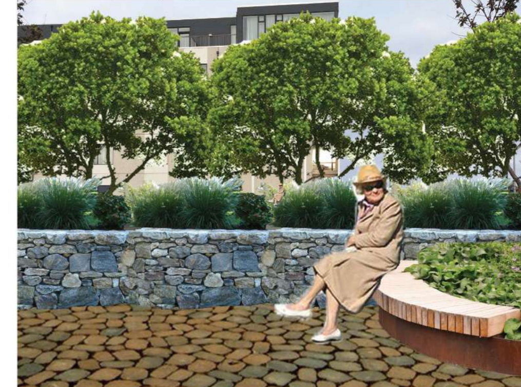
Séð að hóteli eftir breytingu