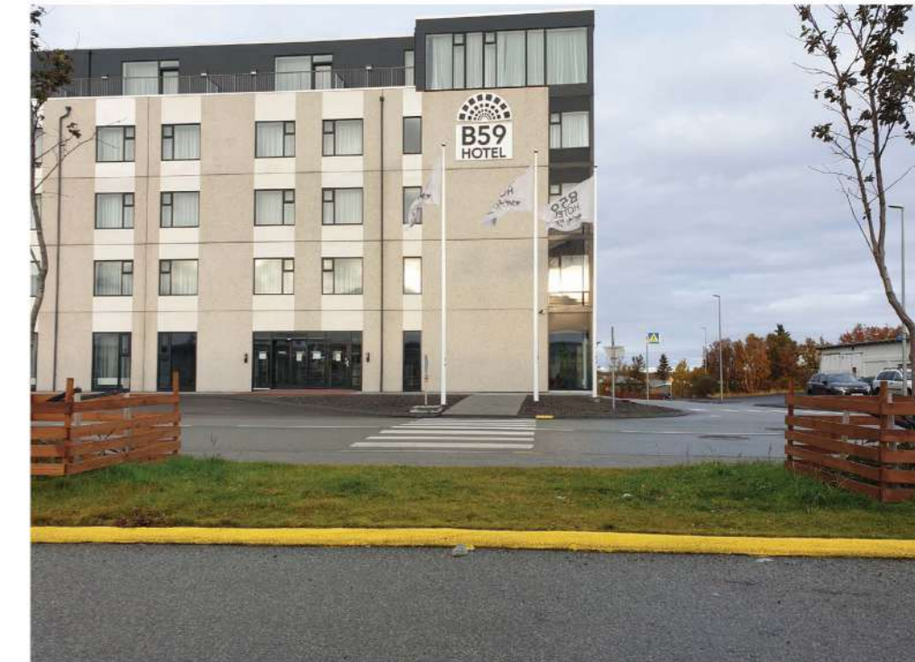
Séð að hóteli fyrir breytingu