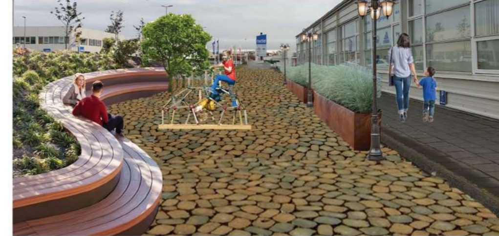
Bílaplan eftir breytingu