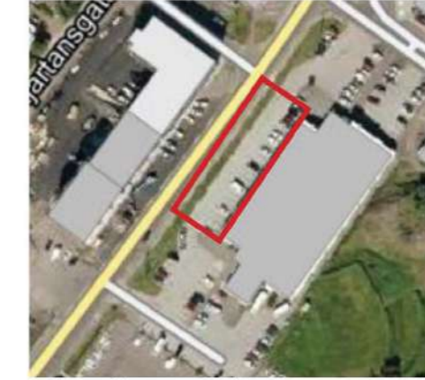
Bílastæði sem verður breytt