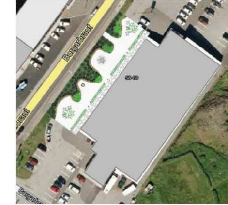
Lokaútkoma á nýju almenningsrými