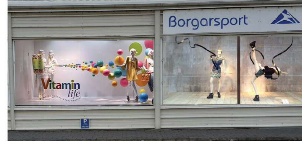
Hugmynd að skemmtilegum útstillingum