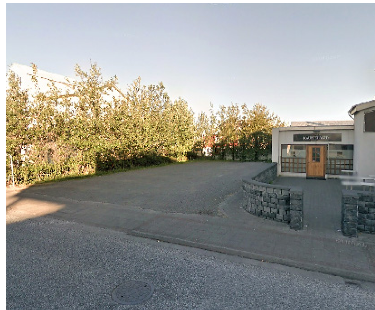
Svæðið fyrir breytingar

Markmiðið er að gera endurbætur á þessu auða malarsvæði sem stendur við Kirkjubraut 11 og hefur síðustu ár verið notað sem bílastæði. Búa til huggulegt almenningsrými með það í huga að svæðið eigi að ýta undir bæði félagslegar og valkvæðar athafnir. Til þess að fólk stundi þessar athafnir þurfa gæði rýmisins að vera réttar. Fólk þarf að geta setið og notið þess að vera á svæðinu, borðað eða leikið sér. Því verður á svæðinu nóg af bekkjum meðfram öllu gróðurbeðinu, einnig borð og stólar sem hægt er að tilla sér og panta sér mat frá Gamla Kaupfélaginu sem stendur við hliðina á bílastæðinu. Timburpallur verður í hægra horni rýmisins sem býður uppá að hægt sé að halda viðburði, t.d tónleika eða leiksýningu. Í almenningsrýminu á að vera mikill gróður, bæði há tré sem veita ákveðna umlykingu og lægri gróður til að bæta yfirsyn. Gróðurinn við göngustíginn/götuna skilur rýmið frá þeirri bílaumferð sem er nokkuð mikil á götunni og gefur þar að leiðandi rýminu ró frá því áreiti sem er að einhverju leiti. Fólk á að geta gengið í gegnum rýmið eða dvalið á því og upplifað í leiðinni endurheimt.