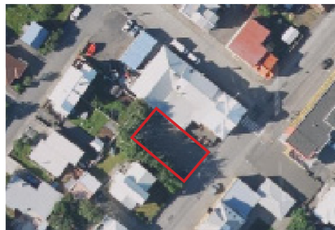
Bílastæði sem verður breytt