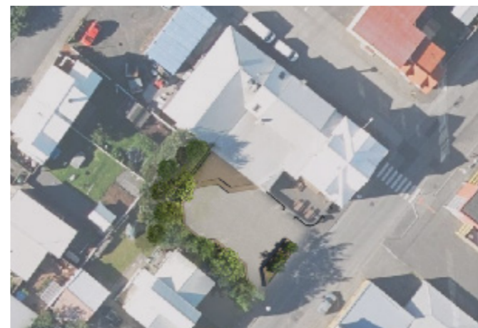
Hugmynd að almenningsrými