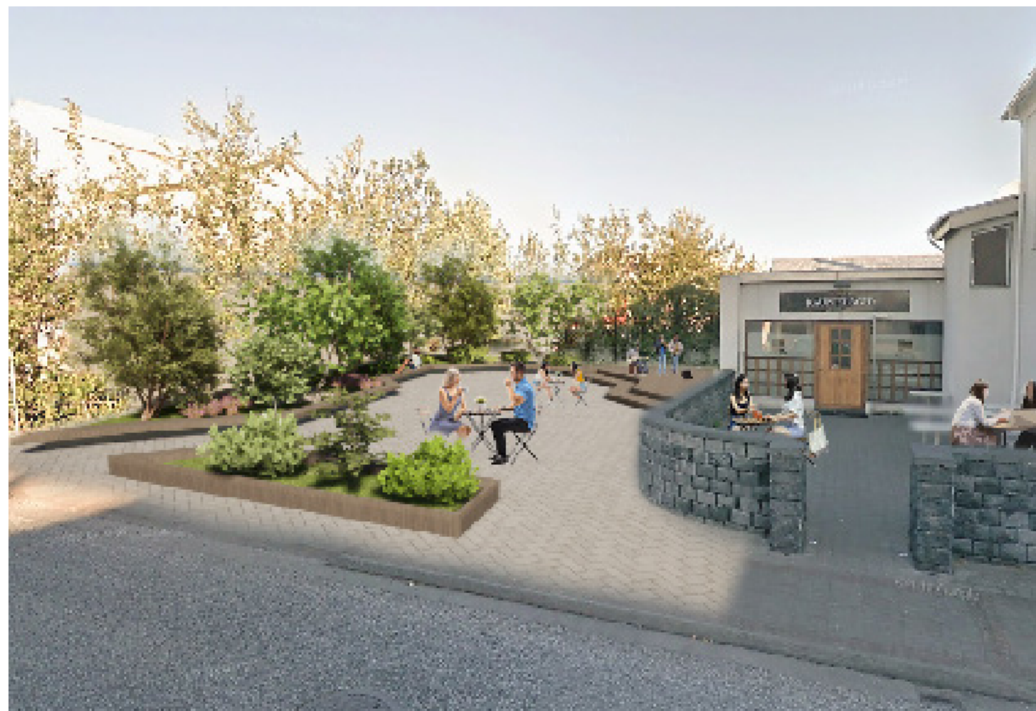
Svæðið eftir breytingar