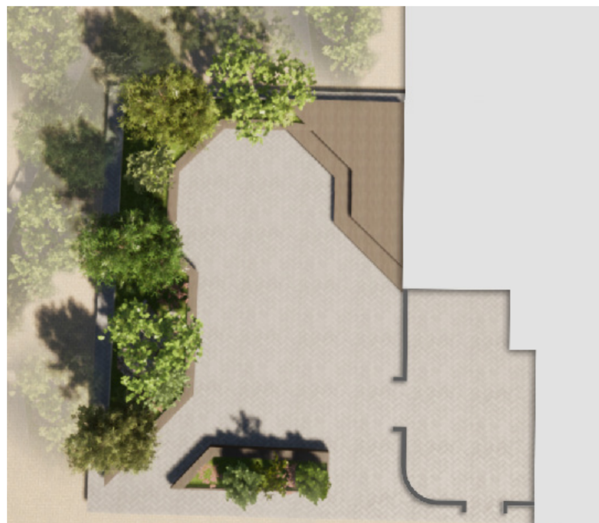
Svæðið séð að ofan